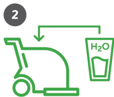
2 Lisää vain vettä!