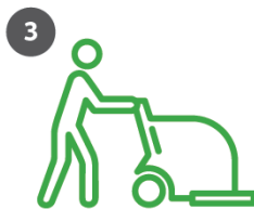
3 Puhdista lattia. Tarkista että ajolinjat ovat mahdollisimman pitkiä ja yhdensuuntaisia sekä osittain päällekkäisiä.