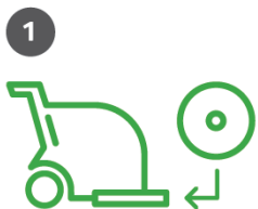
1 Kiinnitä laikka vetoalustaan värillinen, tekstiön puoli kohti lattiaa.

Varusta yhdistelmäkone/lattianhoitokone Twister TXP –laikalla. Toista vaiheita kunnes peruskunnostus on tehty, max 10 ylitystä.